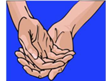
an-ja-li : Folded Hands