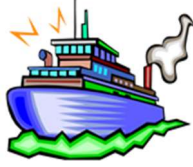
nou-ka : Ship