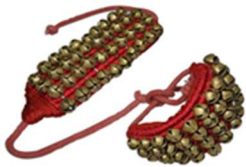
an-de-lu : Ankle Bells