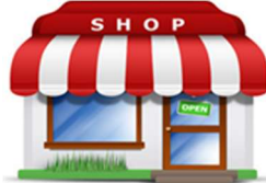
an-ga-Di : Shop