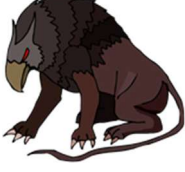
mR-gam : Wild animal