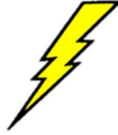
me-ru-pu : Lightning