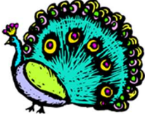
ne-ma-li : Peacock