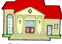
gR-ham : House