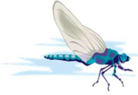
tU-nl-ga : Dragonfly