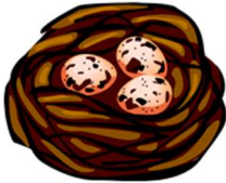
gU-Du : Nest