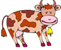
A-vu : Cow