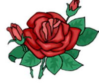
gu-lA-bi : Rose