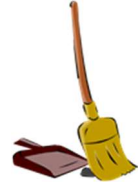
chl-pu-ru : Broom