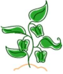
tl-ga : Creeper