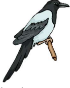
kA-ki : Crow