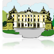
bha-va-nam : Mansion