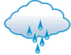
vA-na : Rain