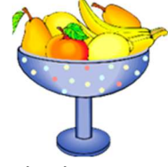
pha-lam : Fruit