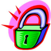
tA-Lam : Lock