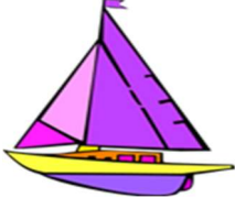
pa-Da-va : Boat